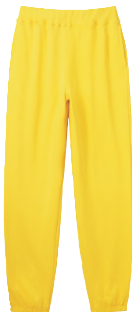
182 カナリアイエロー