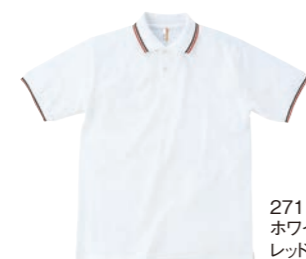
271 ホワイト/ レッド/ブラック