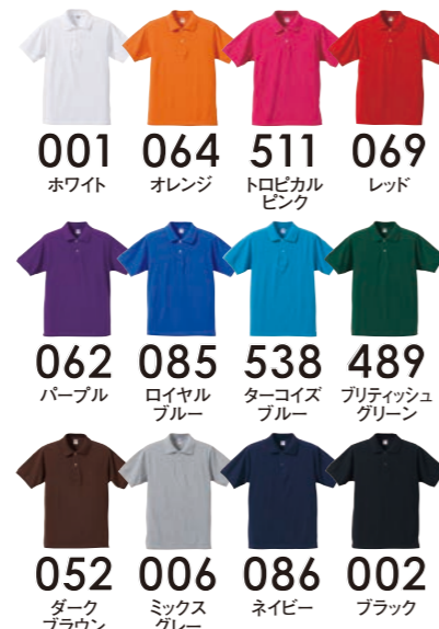
5542-01,064 オレンジ,size:M,model:183cm ※ポロシャツ以外は、弊社の商品ではありません。